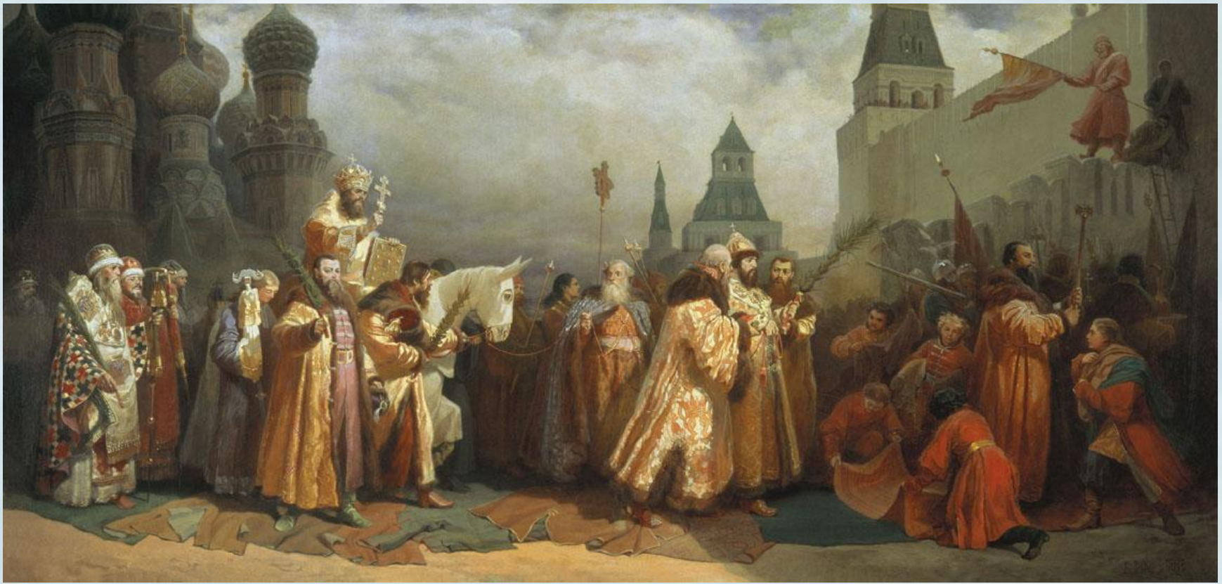
В. Г. Шварц «Шествие на осляти Алексея Михайловича» 1865.

На Руси в праздник Входа Господня в Иерусалим совершалось так называемое «шествие на осляти».